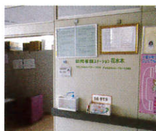
訪問看護ステーション 花水木