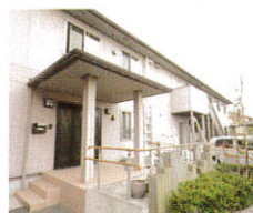
グループホーム つくだ