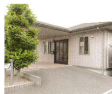
認知症対応サービス からたち