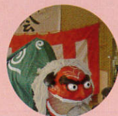
スタッフが獅子舞に化身!