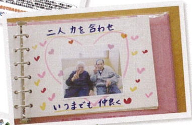
シャンティでの思い出をプレゼントいたします。