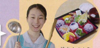
設立イベントの特別お弁当