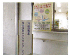
居宅事業所 長田病院ケアプランサービス