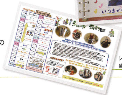
シャンティのイベントは盛りだくさんです♪

ご利用までの流れ ご利用を希望の方は、どのような事でも結構です。お気軽にご相談ください。