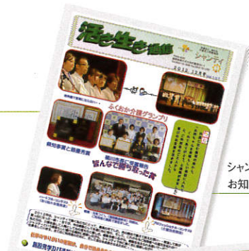
シャンティからのお知らせをお届けします。

介護をしながらの外出は、ご家族だけでは難しいこともあります。シャンティのイベントでご家族皆さまで、安心して楽しい時間をお過ごしください。